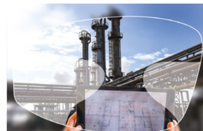
Progressive FreeForm Arizona

Ce verre s'adapte à toutes les activités, pour un port quotidien.