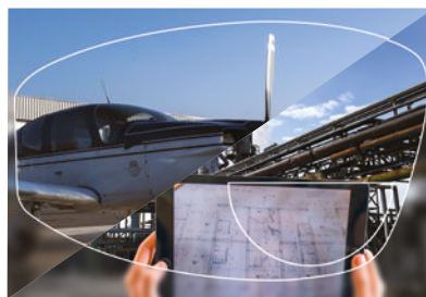
Unifocal FreeForm Colorado

Ce verre offre une adaptation rapide grâce à une vision haute résolution et un confort optimal. Ce verre est recommandé pour les fortes corrections et les montures galbées.