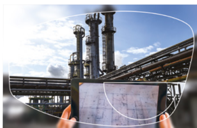
Bifocal D28 Arizona

Destinés aux personnes qui ont besoin d'utiliser la vision de près et la vision de loin : la partie supérieure du verre corrige la vision de loin et la zone inférieure corrige la vision de près.