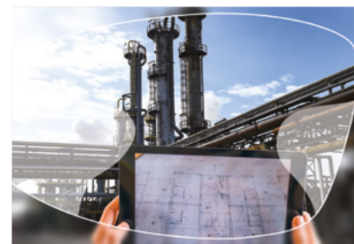
Progressive FreeForm+ Colorado

Plus légers, plus fins et plus esthétiques , les verres FreeForm+ offrent une vision claire à toutes les distances grâce à la technologie la plus innovante sur le marché.